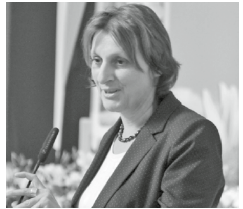
Bildungsministerin Land Brandenburg, SPD Britta Ernst