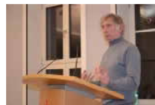
Geboren 1941, ABF Berlin, Studium an der Humboldt Uni und Lehrer in Seelow, Promotion in Potsdam und Dozent bis 2006

„Drei Künstler – Beethoven, Goethe und Goya“