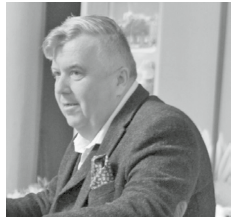
Landrat des LK MOL Gernot Schmidt