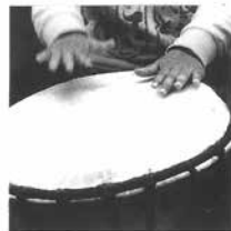
Trommler Musikschüler Frankfurt (Oder)

Sommer - Gottesdienst Sonntag, 10. Juni 2018, 14.00 Uhr