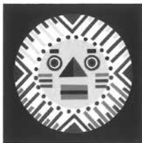
Künstler - Gruppe F 8 Fürstenwalde