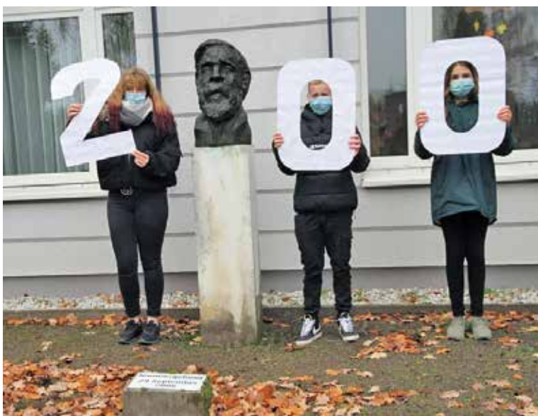
Friedrich Engels Denkmal Neuhardenberg